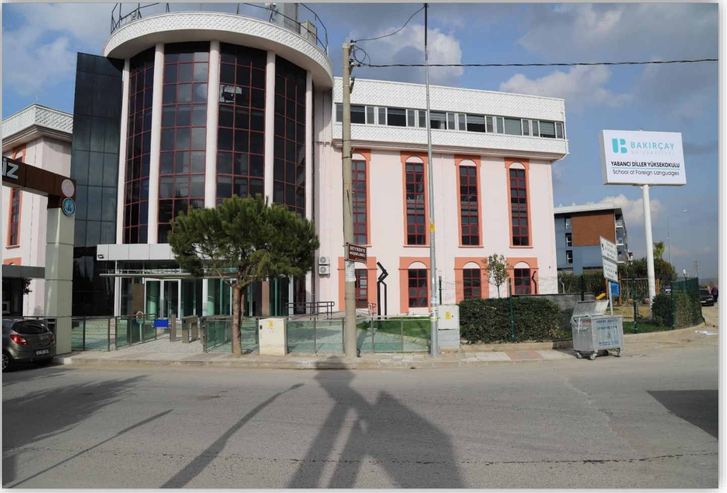
Yabancı Diller Yüksekokulu Yerleşkesi